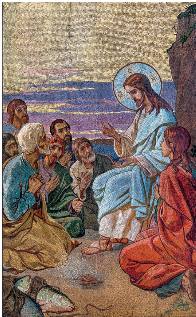
Христос на Тивериадском озере. Мозаика по оригиналу Н.П.Шаховского. Храм Воскресения Христова (Спас на Крови). 1902.

Прошло чуть более ста лет со дня этого трагического события. Имя художника оказалось практически забыто. Ныне произведения, созданные Шаховским, хранятся в ряде музеев России. Среди них Государственный музей-памятник «Исаакиевский собор» обладает одним из самых больших собраний рисунков и набросков, выполненных художником с 1890-х по 1912 год. Художественные сюжеты этой коллекции разнообразны – портреты членов семьи