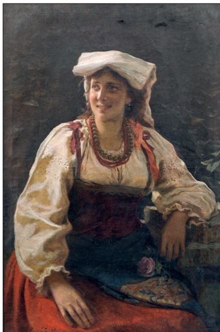
Молодая итальянка-альбанка. Холст, масло. 1887. Государственный музей-памятник «Исаакиевский собор».

Изображая Иисуса Христа, Шаховской следует Евангелию от Луки: «Явился же Ему Ангел с небес и укреплял Его» (Лк. 22:43). Ангел в светлом одеянии предстает в луче света. Дальний план теряется в темноте: между деревьев слева еле видны фигуры спящих учеников. На фоне общего темного тона смальт ярко выделяется крещатый нимб