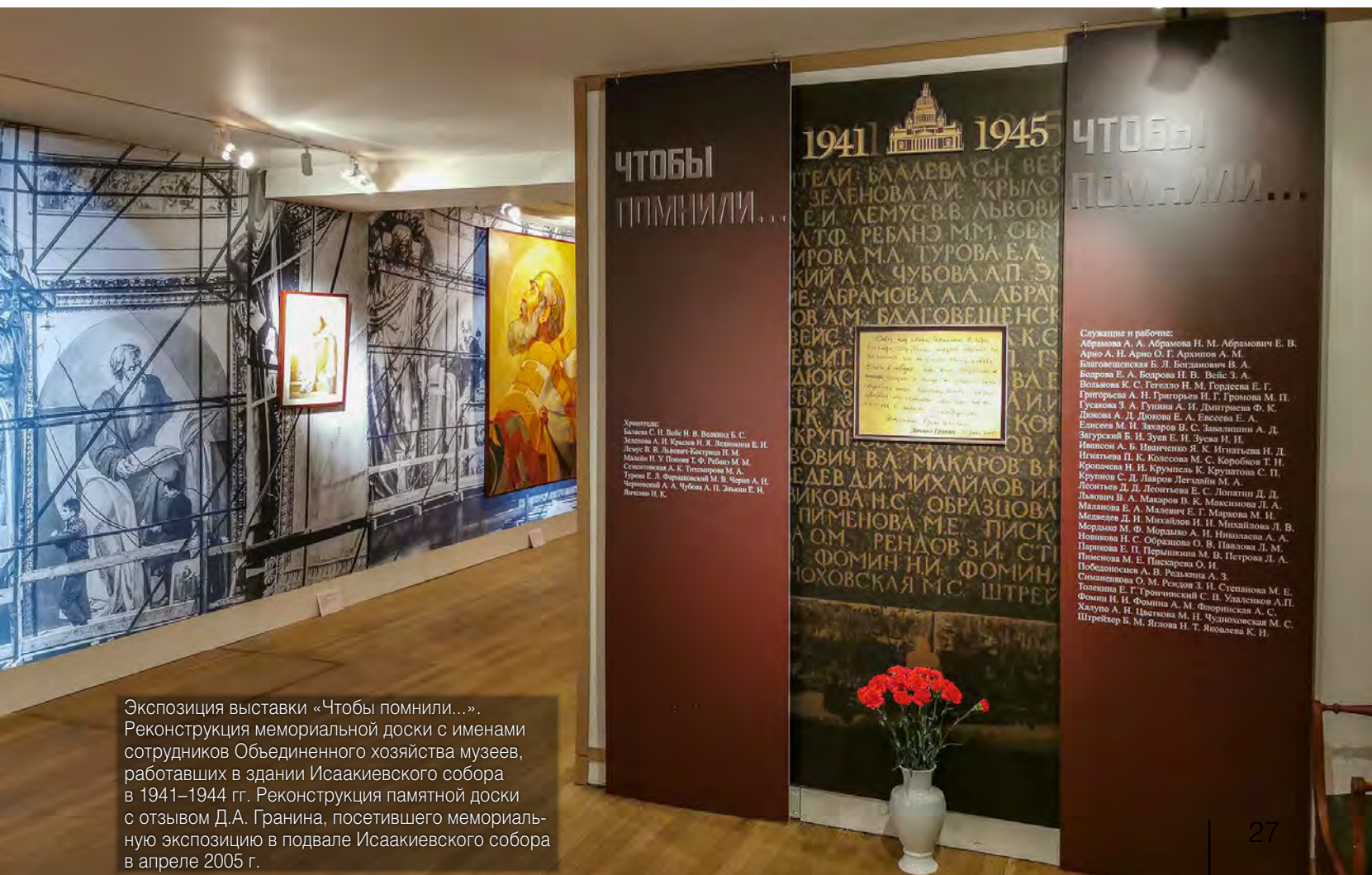
Экспозиция выставки «Чтобы помнили...». Реконструкция мемориальной доски с именами сотрудников Объединенного хозяйства музеев, работавших в здании Исаакиевского собора в 1941–1944 гг. Реконструкция памятной доски с отзывом Д.А. Гранина, посетившего мемориальную экспозицию в подвале Исаакиевского собора в апреле 2005 г.