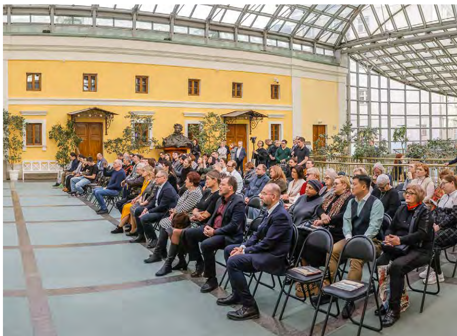
Открытие выставки «Чтобы помнили...». 17 марта 2025 г.