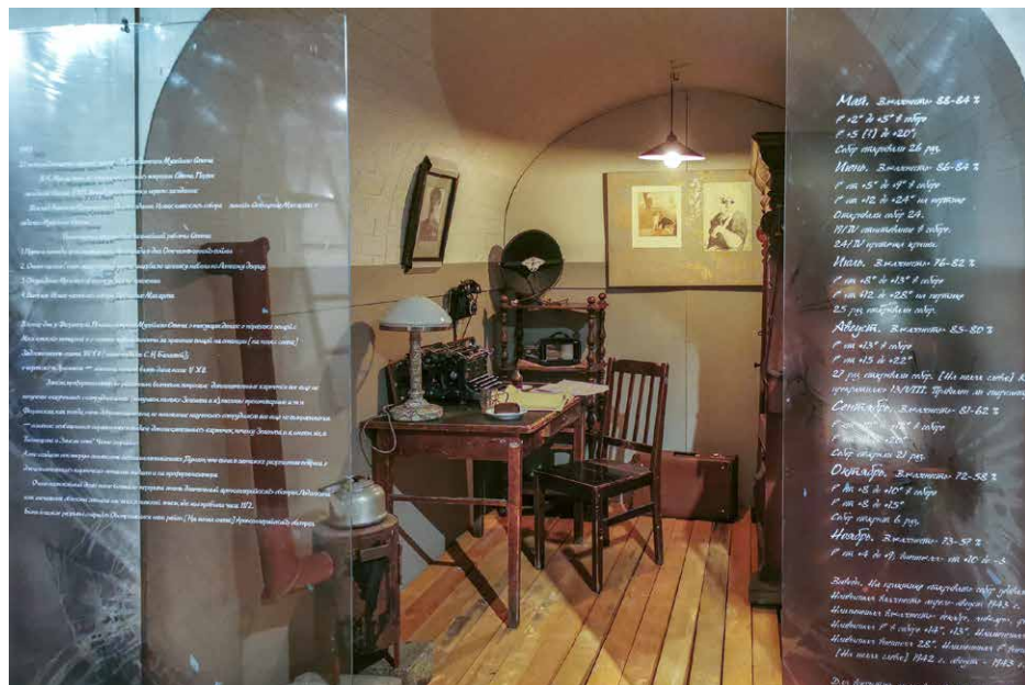
Экспозиция выставки «Чтобы помнили...». Реконструкция кабинета хранителя