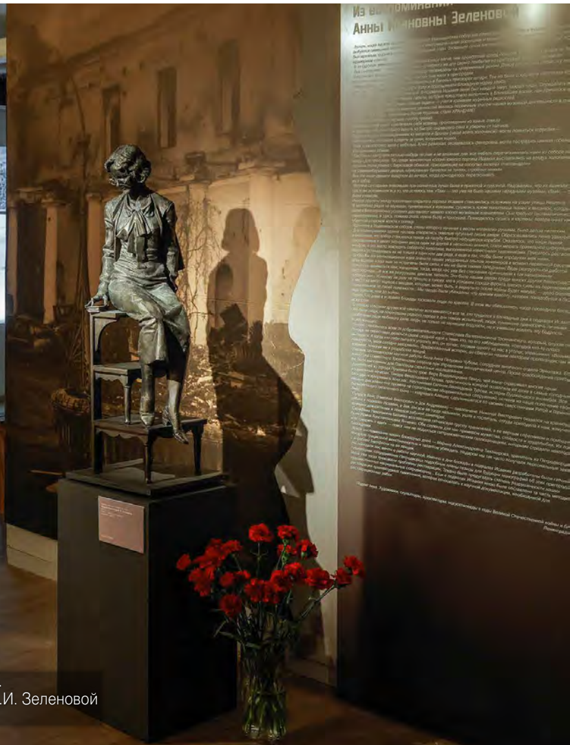
Экспозиция выставки «Чтобы помнили...». На переднем плане – модель памятника А.И. Зеленовой (2010-е гг., скульптор В.Э. Горевой)