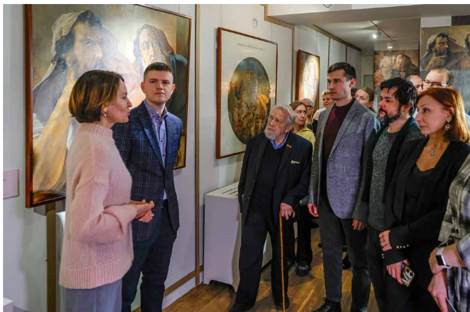
Экскурсия по выставке «Чтобы помнили...». 17 марта 2025 г.