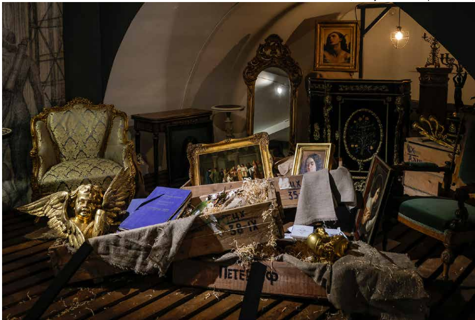
Экспозиция выставки «Чтобы помнили...». Инсталляция музейного хранилища

и требовательностью как к себе, так и к окружающим. Даже обстрелы она воспринимала как досадную помеху, мешавшую ей работать.