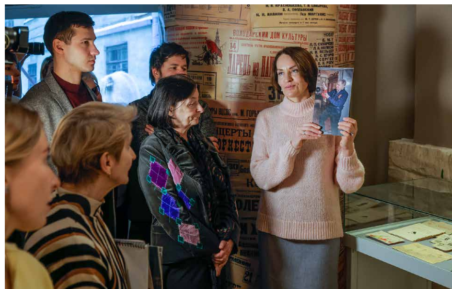
Экскурсия по выставке «Чтобы помнили...». 17 марта 2025 г.

Экспонаты последней очереди эвакуировать в тыл уже не представлялось возможным: вокруг города сжималось кольцо блокады, транспортные пути были отрезаны. Незапланированным и