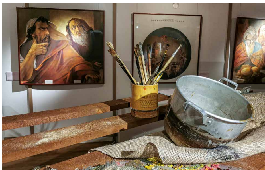
Экспозиция выставки «Чтобы помнили...». Зал, посвященный реставрации Исаакиевского собора в 1945–1963 гг.

В результате длительного нарушения температурно-влажностного режима