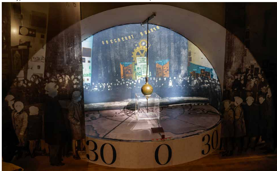
Экспозиция выставки «Чтобы помнили...». Инсталляция, посвященная проведению опыта с маятником Фуко