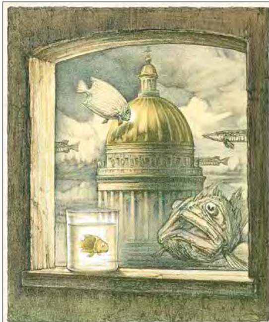
Ю. А. Столяров. Рыбы с Исаакием. 1999. Цветная литография.

Графика, хранящаяся в музейных фондах Государственного музея-памятника «Исаакиевский собор», хоть и не является частью постоянной музейной экспозиции, тем не менее активно экспонируется на различных тематических выставках и публикуется в изданиях, выпускаемых как са-