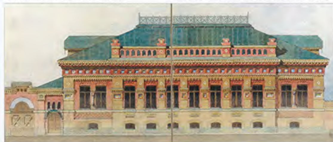
А. А. Парланд. Проект дома Н. Г. Глушковой. Фасад по Большой Дворянской улице. 1874. Бумага, акварель, карандаш. 37 x 47. Центральный государственный исторический архив Санкт-Петербурга.