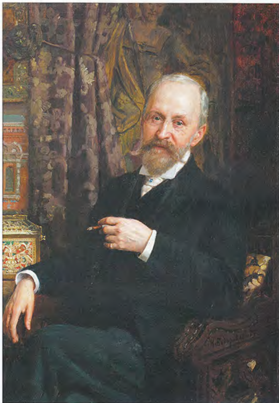
Слева: Н.К. Бодаревский. Портрет архитектора А.А. Парланда. 1908.

Холст, масло. 90 x 63. ГМП «Исаакиевский собор». • На с. 29: А.А. Парланд. Церковь Г.Ф. Ракеева во имя Св. Феодора. 1887(?). Бумага, архитектурная отмывка, тушь, кисть, карандаш, перо, рисунок, рукопись. 50,7 x 35,5. ГМП «Исаакиевский собор».