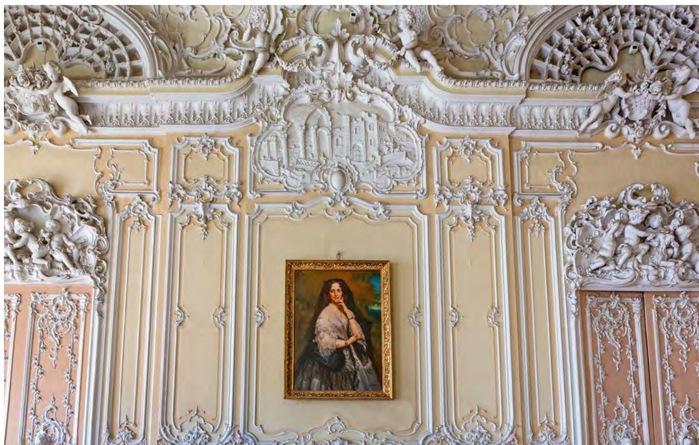
Танцевальный (Белый) зал

Так, например, фасад здания, богато украшенный декоративной пластикой и отделанный разными сортами песчаника, в числе которых гатчинский и бременский, срочно нуждается в реставрации. Эти работы, в силу обеспечения безопасности прохождения рядом с домом, были начаты музеем безотлагательно. При обследовании было выявлено, что облицовка фасада не только сильно загрязнена, впитала копоть мегаполиса, превратившись из светло-желтой, почти белой, в темно-серую, но и растрескивается во многих местах. Возможно, причиной этого является нарушение методики реставрации во время проведения предыдущих работ или ее несостоятельности на тот период, в результате чего произошло изменение в структуре камня, соприкасающегося с цементными вставками и в местах обработки. Проблема реставрации облицовочного камня – несмотря на развитие технологий, одна из