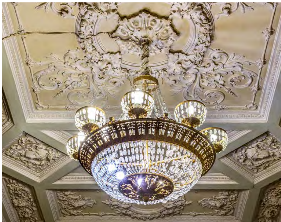
Плафон Золотой гостиной