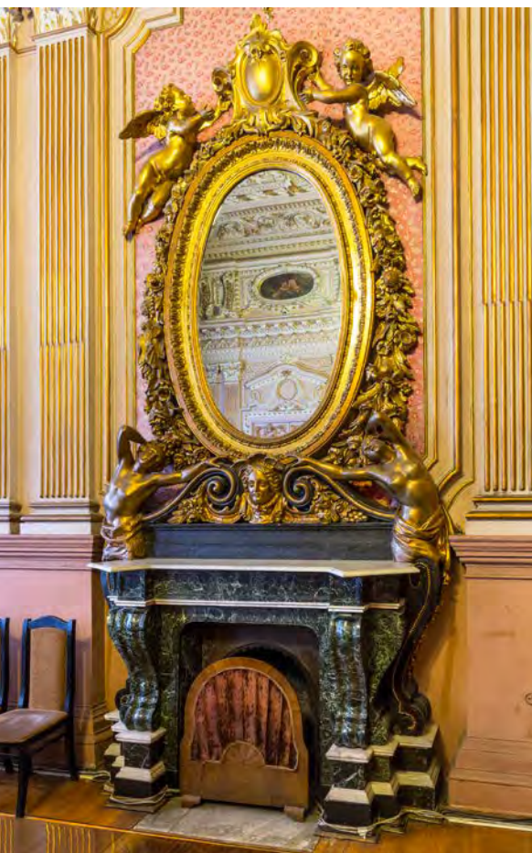
Камин в Золотой гостиной